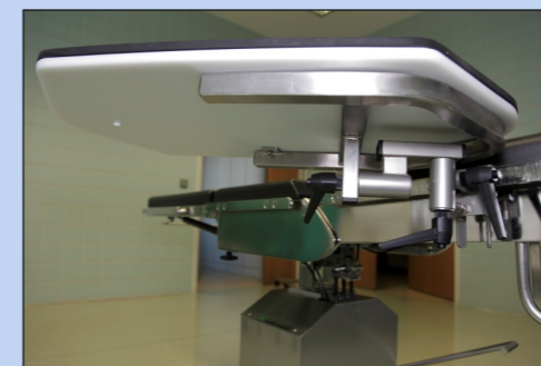
schwenkbar in 3 Ebenen